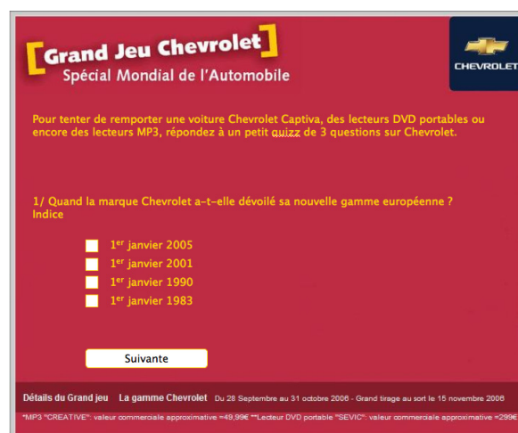
Ici : 3 questions - 1 question par page

A l'occasion du mondial de l'automobile 2006, découvrez les nouveautés Chevrolet et participez au Grand Jeu.