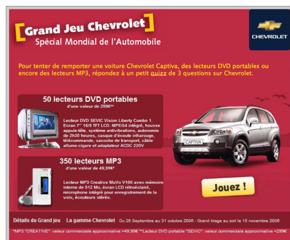
Présentation du jeu et des lots

A l'occasion du mondial de l'automobile 2006, découvrez les nouveautés Chevrolet et participez au Grand Jeu.